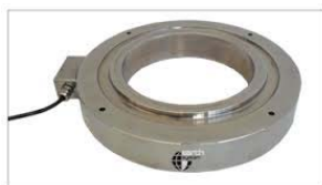
cella di carico