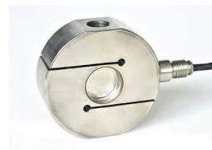
cella di trazione