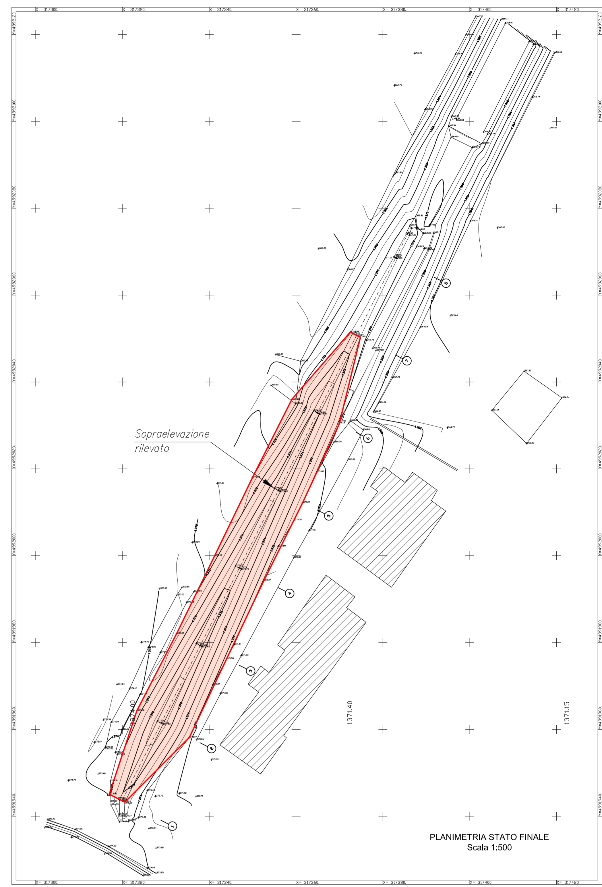
PLANIMETRIA STATO FINALE Scala 1:500