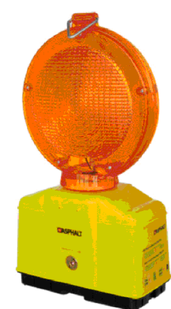
TIPOLOGIA LAMPADA PER SEGNALAZIONE RECINZIONE AREE STOCCAGGIO